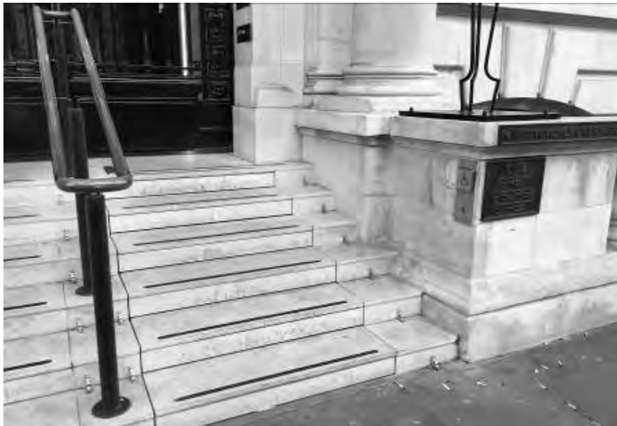
Fig. 5 – Dettaglio della scala retrattile a scomparsa.