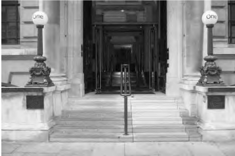
Fig. 4 – Vista d'insieme della scala retrattile a scomparsa (immagine tratta dal sito: https://www.youtube.com/watchv=_hvpZmM9iBw ).