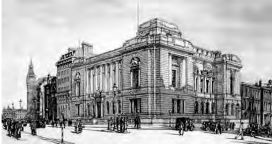
Fig. 1 – Disegno d'epoca dell'Institution of Civil Engineers building, 1938 by Sir Henry Rushbury.