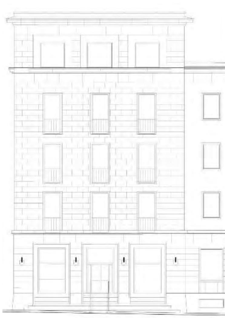
Fig. 16 – Prospetto principale su via Riva Forte Gallo su cui sarà inserita la scala retrattile Sesame. (grafico di progetto).

multaneamente alla scomparsa dei gradini, si sollevano dalla scala i dispositivi di sicurezza (parapetti) che hanno la duplice funzione di impedire la caduta nel vuoto di eventuali utenti che occupano il pianerottolo di smonto e del diversamente abile marciante su sedia a ruote o qualsiasi altro utilizzatore della piattaforma durante la salita della stessa. Il meccanismo che consente l'automatismo della salita con la piattaforma sarà prodotto dalla Sesame Access Systems Ltd.