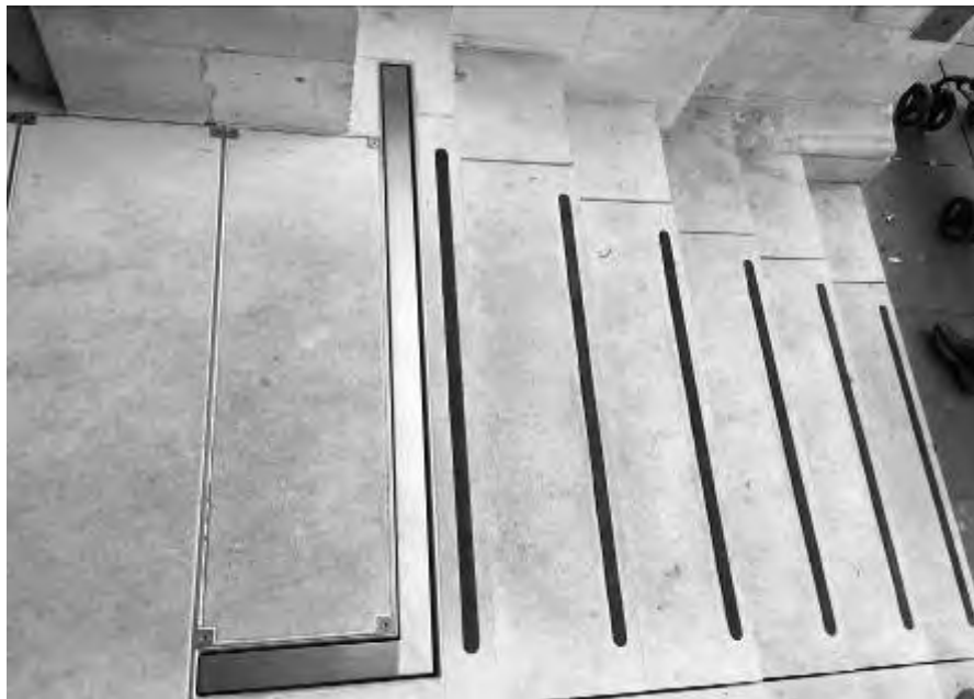
Fig. 7 – Dettaglio del parapetto di protezione (foto di Luigi Iannone, anno 2016).