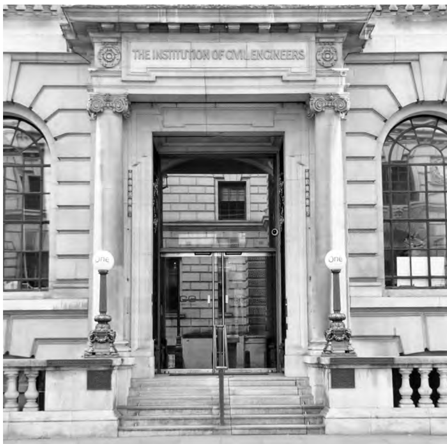
Fig. 3 – Particolare dell'ingresso principale dell'Institution of Civil Engineers di Londra su cui è stata installata la scala retrattile a scomparsa.

Il meccanismo con gradini retrattili consente di assolvere ad una doppia funzione, di scala e di piattaforma elevatrice. Quando l'elevatore non è in uso è possibile utilizzare l'intera ampiezza della scala ad uso pedonale. Quando, invece, è in uso la piattaforma, una parte dei gradini della scala si ritrae, lasciando emergere l'elevatore che presenta una larghezza sufficiente ad accogliere una persona diversamente abile e un eventuale accompagnatore. Si ritiene opportuno precisare che, con questo tipo di automazione, l'accompagnatore non è indispensabile in quanto la persona diversamente abile viene resa completamente autosufficiente dal momento che può, per il tramite di una pulsantiera, avvisare del suo arrivo in portineria; da qui un