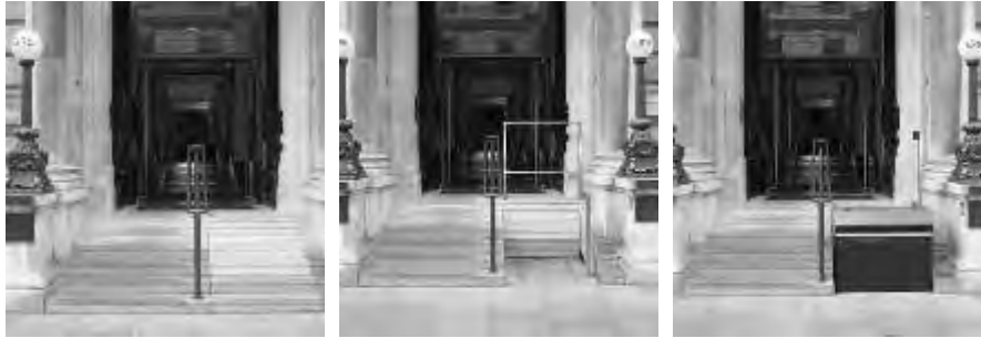
Figg. 10, 11, 12 – Sequenza di immagini che illustra il funzionamento della scala retrattile che, arretrando, lascia spazio alla piattaforma elevatrice (immagini tratte da: www.sesameaccess.com/lift-styles ).