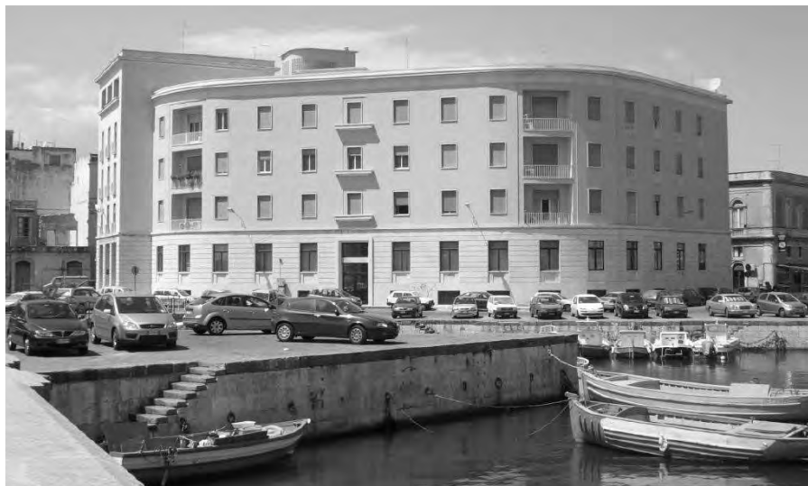
Fig. 14 – Vista della facciata dell'edificio prospiciente via Riva Forte Gallo da Ponte Umberto (immagine tratta dalla relazione di progetto).