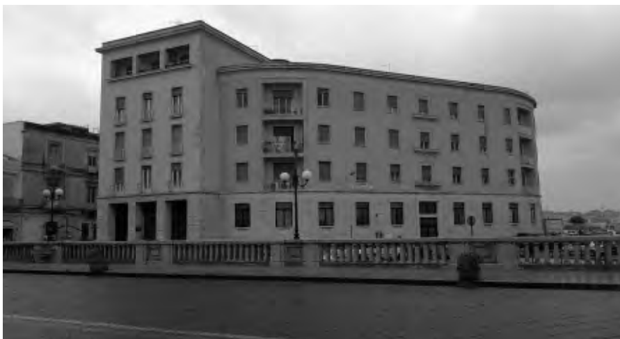
Fig. 15 – Vista della facciata e dell'ingresso principale all'edificio prospiciente via Riva Forte Gallo.

Attualmente gli uffici della sede INAIL occupano parte dei piani seminterrato, rialzato e primo mentre i restanti piani sono destinati ad abitazioni private; in particolare: al piano seminterrato sono collocati gli archivi e i depositi dell'ente, l'ex appartamento del portiere, il locale caldaia e il locale serbatoio combustibile; al piano rialzato sono ubicati parte degli uffici amministrativi, il poliambulatorio con accesso esclusivo da via Luigi Greco Cassia e la struttura di diagnostica per immagini (sala RX); al piano primo sono ubicati il resto degli uffici amministrativi e quelli della direzione. A tale piano oggi si accede mediante l'utilizzo di una scala in acciaio posta in prossimità dell'atrio.