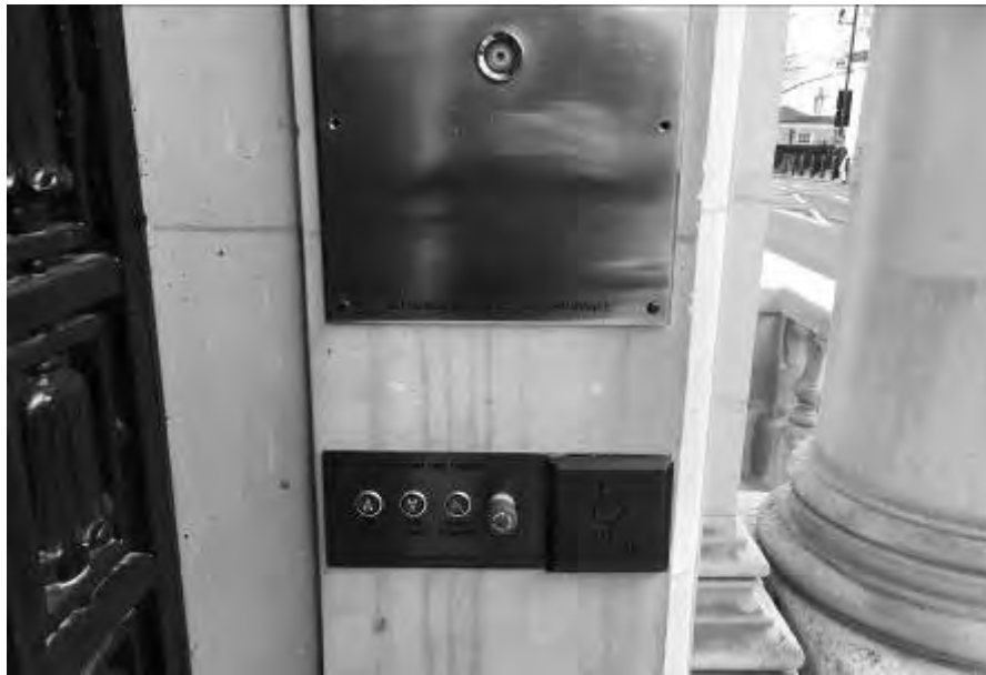
Figg. 8, 9 – Dettaglio delle pulsantiere ubicate a monte e a valle della scala che consentono l'arretramento della stessa e l'attivazione della piattaforma elevatrice (foto di Luigi Iannone, anno 2016).