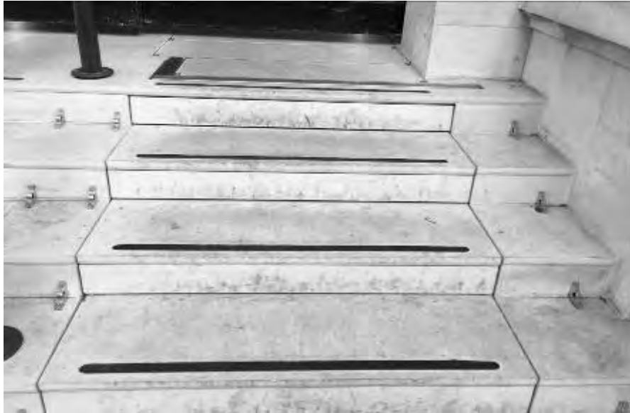
Fig. 6 – Immagine che illustra il dettaglio della scala retrattile completamente integrata nella facciata originaria (foto di L. Iannone, anno 2016).