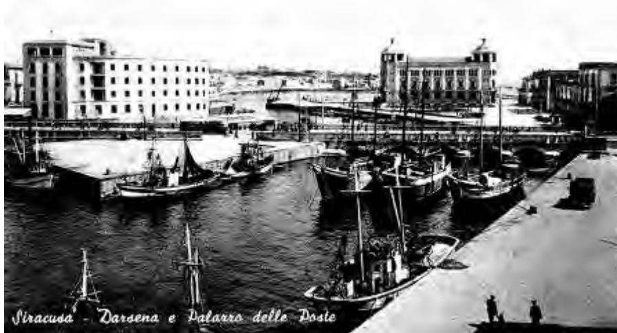
Fig. 13 – Cartolina d'epoca da cui si distingue chiaramente il Palazzo dell'INAIL e in lontananza il Palazzo delle Poste.

colore, ad eccezione della fascia di coronamento in copertura e del corpo aggettante, costituente l'ingresso principale, che ripropone, per colore e finitura, il rivestimento lapideo del piano rialzato.