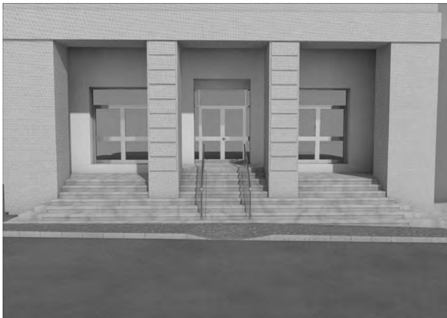
Figg. 17, 18 – Rappresentazioni fotorealistiche dell'intervento di adeguamento per il superamento delle barriere architettoniche progettato per la sede INAIL di Siracusa (grafici di progetto).