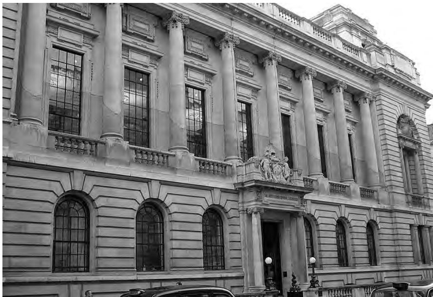
Fig. 2 – Foto attuale della facciata principale dell'edificio prospiciente Great George Street.